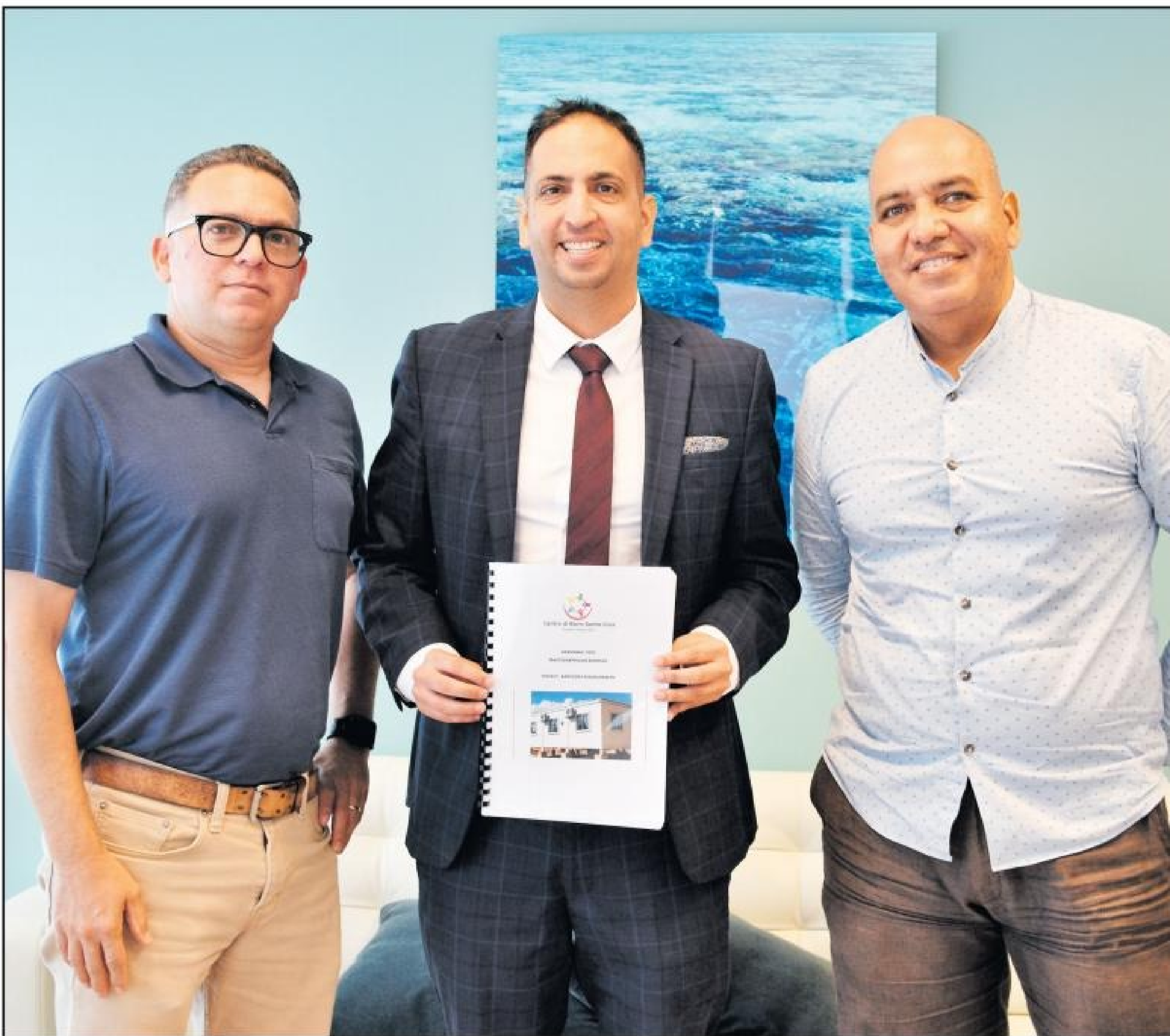
Minister Dangui Oduber ta apoya proyecto caminda ta promove nos hobennan pa hiba un bida saludabel door di practica deporte.

Pa haci esaki posibel e stichting tin mester di lokalnan di klas estilo prefab, pa es motibo e stichting a acudi serca Minister Oduber pa mira con por yuda cu esaki.